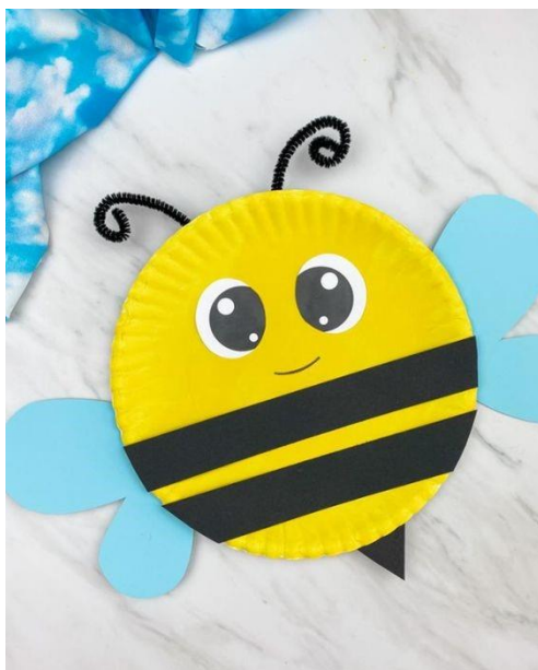
Rysunek 1. https://pl.pinterest.com/pin/269090146474234666/

Dzieci siadają na dywanie w kole. Nauczyciel pokazuje dzieciom elementy papierowe z których będą wykonywać pracę plastyczną i tłumaczy co po kolei trzeba wykonać. Przypomina jak używać kleju.